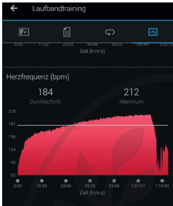
► Abb. 4 Kontinuierlicher Anstieg der Herzfrequenz während einer Hitzeadaptationseinheit bis zur Erschöpfung (Gehen auf dem Laufband) bei gleichbleibender oder teilweise reduzierter Geschwindigkeit.

(► Abb. 4 ), selbst wenn die Belastung lediglich im Bereich der aeroben Schwelle bleibt. Unter Hitzebelastung werden entsprechend bei gleichem Tempo auch höhere Laktatwerte gemessen.