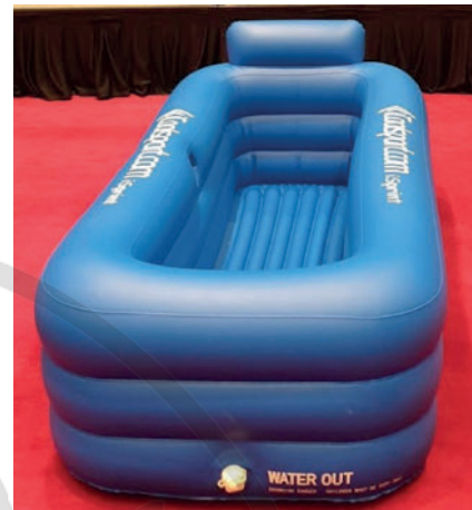
► Abb. 5 Mobiles Kaltwasserbecken für Wettkämpfe/ Hitzetraining.

Ein Kaltwasserbad bietet die schnellste Möglichkeit, den Körper nach Überhitzung herunterzukühlen. Bei sofortiger Anwendung besteht selbst nach einem Hitzschlag fast ein kompletter Schutz vor einem schwerwiegenden Verlauf [5][10]. Aus diesem Grund sollten bei Wettkämpfen unter Hitzebedingungen unbedingt Kaltwasserbäder im Zielbereich bzw. Medizinbereich vorgehalten werden (► Abb. 5 ). Kalte Duschen sind aufgrund der mangelnden Kühlkapazität sowie der ggfs. notwendigen Schocklagerung der Sportler/-innen dem Kaltwasserbad unterlegen. Aus eigener Erfahrung in der Wettkampfbetreuung sollten jedoch alle schnell verfügbaren Möglichkeiten der Kühlung in der Notfallsituation genutzt werden.