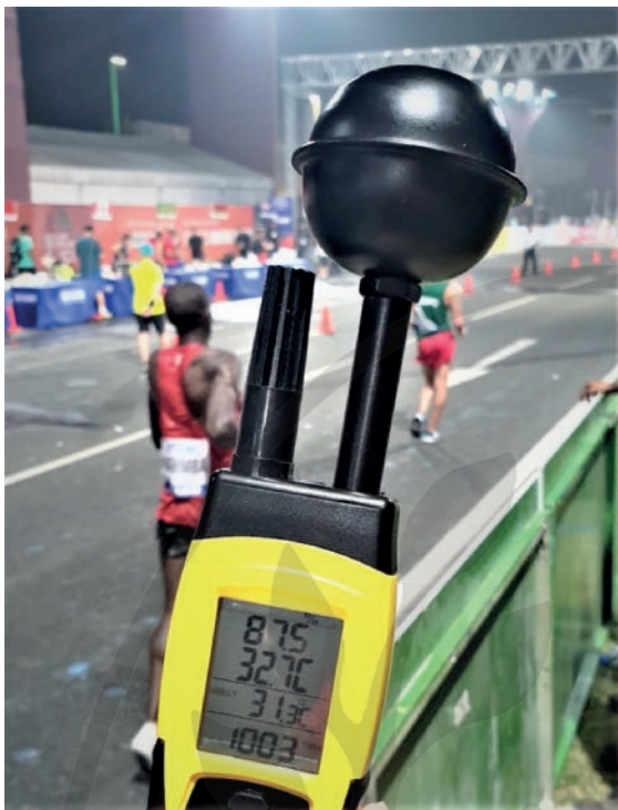
► Abb. 1 WBGT-Messgerät während der Leichtathletik-Weltmeisterschaft 2019 in Doha/Katar um Mitternacht.