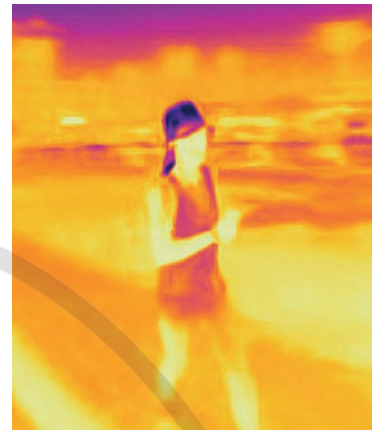
► Abb. 2 Monitoring des Kühlens während des Wettkampfs mit kühlender Kopfbedeckung und Kleidung (Percooling) mittels Wärmebildkamera während der Leichtathletik-Weltmeisterschaft in Doha/Katar 2019.

Zur externen Kühlung vor einem Hitzewettkampf stehen verschiedene Möglichkeiten zur Auswahl. Diese können je nach Möglichkeit angewandt werden [3]. Am verbreitetsten ist Kühlkleidung (Weste, Ärmlinge, Kopfbedeckung, Beinlinge). Sie funktionieren entweder über Evaporation (bei großer innerer Oberfläche nach Einweichen in Wasser) oder nach Befüllung mit Kühlakkus (Eisweste) und entsprechender Wärmeabgabe daran über Konduktion. Letztere sind bei hoher Luftfeuchte zu bevorzugen, weil Evaporation dann schlechter funktioniert. Aus eigener Erfahrung